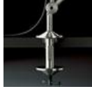
TOLOMEO MORSETTO A004100