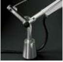
TOLOMEO SUPP.TAVOLO FISSO A004200