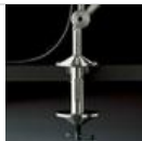
TOLOMEO MORSETTO A004100