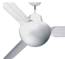
EVOLUTION LIGHT KIT ES Codice 22414