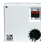
SCRR5 Codice 12963 →