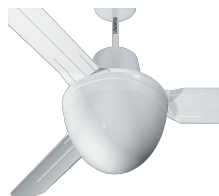
EVOLUTION LIGHT KIT Codice 22413