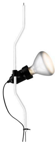
F5500009 Parentesi elemento complemento - Bianco

di Achille Castiglioni & Pio Manzù , 1971