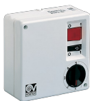
SCNRL5 UNIF. X NK SOFFITTO Codice 12957