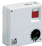
SCNR/M SCAT.COM. NON REV. MULT. Codice 12982