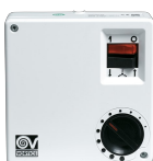
SCNR5 UNIF.X NK SOFFITTO